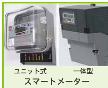
ユニット式 一体型 スマートメーター